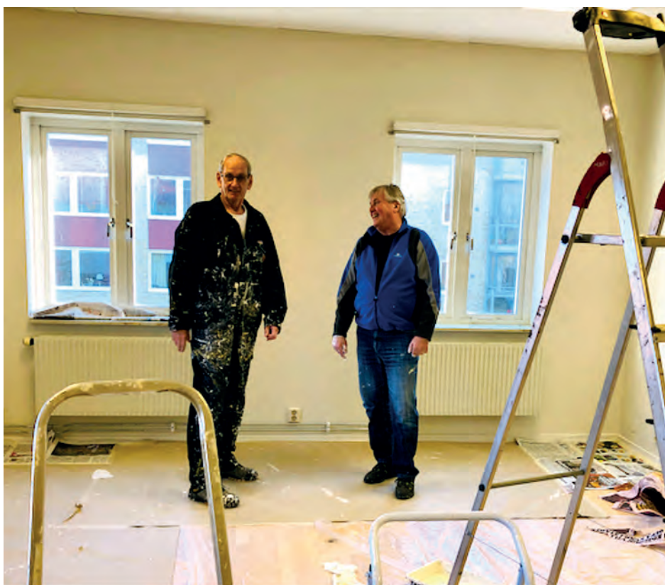
Nya kansliet målas och städas.

Du kan även via denna hemsida logga in på PB Arkivet, tidigare benämnt kansli systemet.