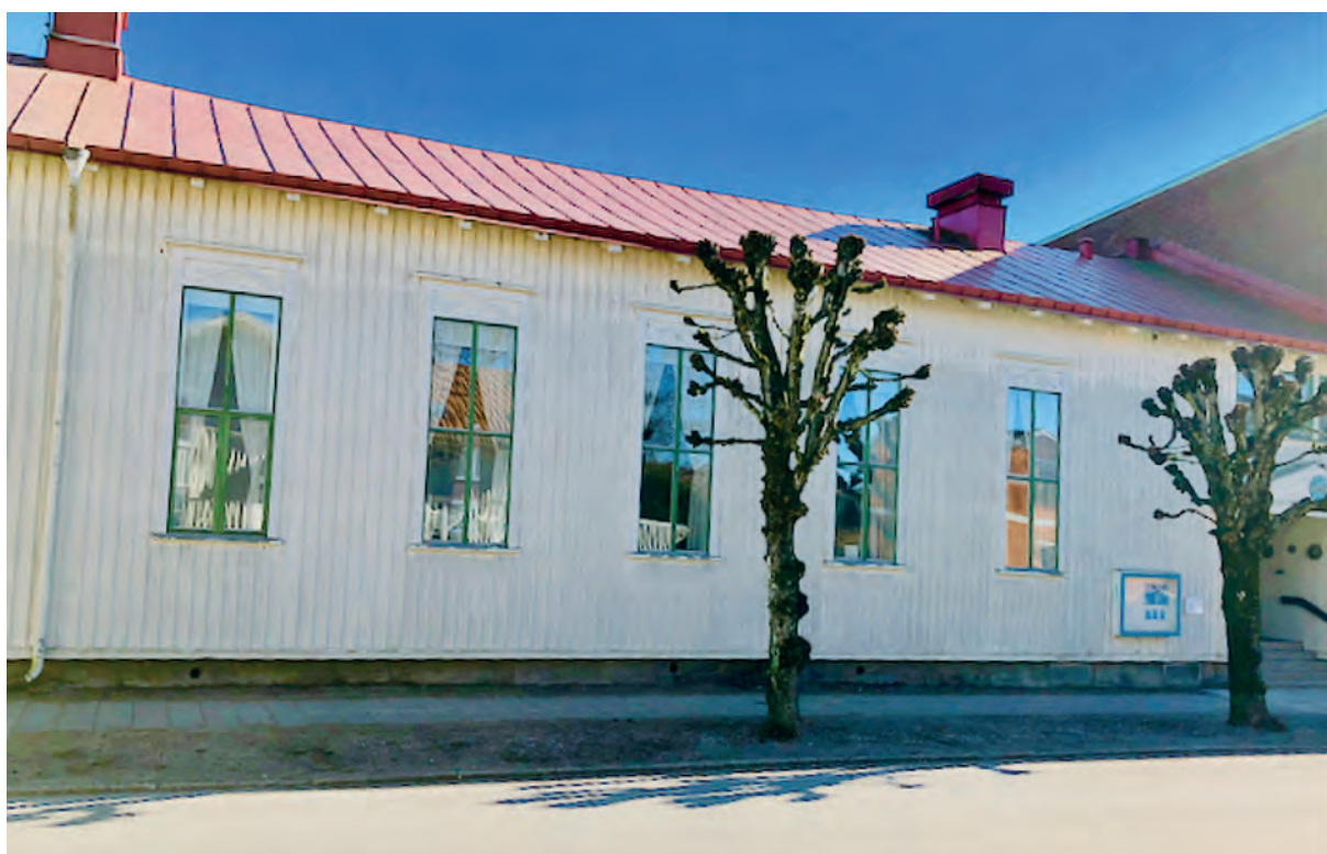
Nya ordenshuset som nu skall väckas ur sin törnrosasömn.

Vårt nya ordenshus Vallgatan / Nygatan håller på att likt fågel Fenix resa sig om inte ur askan så åtminstone ur en långvarig törnrosasömn.