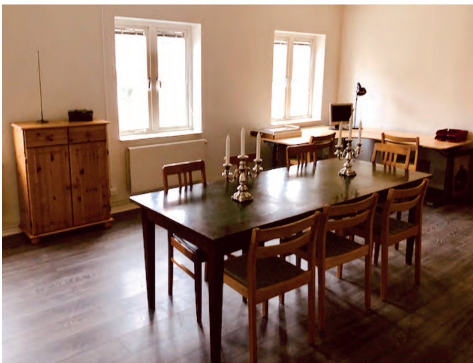
Sammanträdesrummet redan döpt till Bellmanrummet.

Mycket arbete återstår innan alla lokaler kan tas i bruk, allt arbete utförs av bröder som offrar sin fritid för att vi äntligen skall