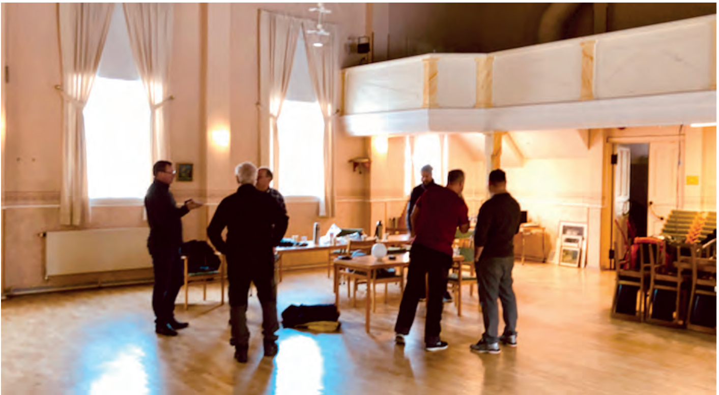
Flitiga bröder i ordenslokalen.

kunna samla all verksamhet och alla våra "ägodelar" på ett och samma ställe.