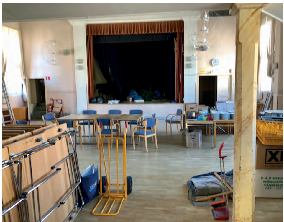
Stolar och bord trängs i nya ordenslokalen.

årtionden, förbud kommit och gått, men problemen med superiet kvarstod. Nykterhetsföreningar och loger uppstod, f.f.a. under 1800-talet, ofta sprungna ur kyrklig verksamhet. Ordenssällskapen var, som vi väl känner till, många så det var naturligt att även nykterhetsföreningarna bildade sådana. Vi känner igen omåttlighetsproblematiken och dess följder från våra egna ritualer, även om Par Bricole inte kan räknas som en nykterhetsorden, så insåg man vådan av ett ohejdat supande, vilket framgår tydligt i våra ritualer och